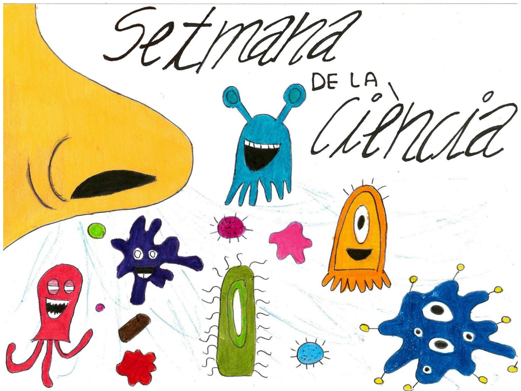
Il·lustració: Elena Varas